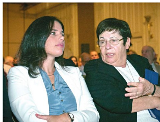
נאור (מימין) ושקד. מאבקי כוח

לדברי עו"ד יבוביץ', אין בעיה של גיוון בעליון, "יש לנו את סאלים ג'ובראן שהוא נוצרי, את אליקים רובינשטיין שהוא דתי, את מרים נאור, שדעותיה אחרות. הם לא עשויים מקשה אחת". לשאלה מה עם ייצוג לנשים, ללוחמי זכויות אדם ועוד, השיב ליבוביץ': "כמו שכשאני הולך לניתוח, הדבר האחרון שמעניין אותי זה אם המנתח הוא גבר, אישה, ערבי, יהודי, מתנחל או שמאלני. מה שמעניין אותי הוא אם הוא מקצוען. כך זה לא צריך לעניין אותנו בנוגע לזהות השופט לעליון".